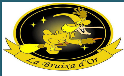
Sort - La Bruixa d'Or

Fins a la II Guerra Mundial Andorra va ser un país molt pobre i aïllat, excepte per a algun hereu o publiilla que tingués la sort d'heretar un bon ramat o un bon camp de tabac. Però durant la guerra el país va ser lloc de pas i refugi de tots aquells que fugien del nazis. A Andorra el contraband, ja fos de bens o de persones, no era delictes i comptava amb una llarga tradició. De fet, el repentí ascens econòmic del país ha contribuït a alimentar la llegenda de les fabuloses Fortunes que algunes famílies andornnes varen amassar precisament durant la guerra. Avui en dia la imatge d'Andorra es la d'un país pròsper gracies al turisme, el comerç i els esports de muntanya.