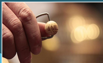
Loteria de Nadal